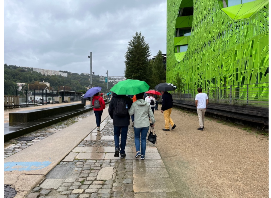
Le Cube Orange, Jacob + MacFarlane 2010 – Arbeiterstadt und Théâtre National Populaire, Môrce Leroux 1930