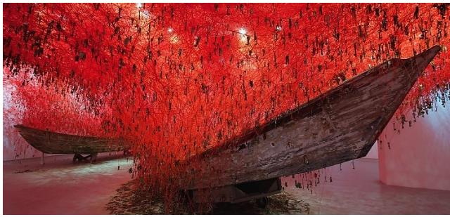
Shiharu Shiota / Biennale di Venezia 2015 / Japan Pavilion